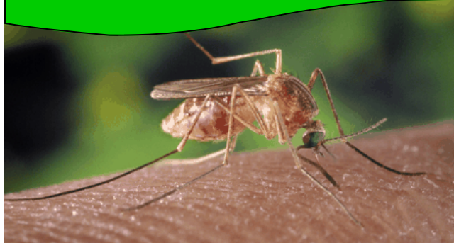
Culex quinquefasciatus mosquito